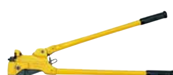
ラチェット全ネジカッタ