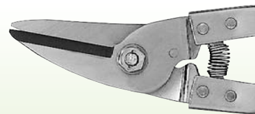
■ステンレス製ハンディカッターシリーズ仕様表