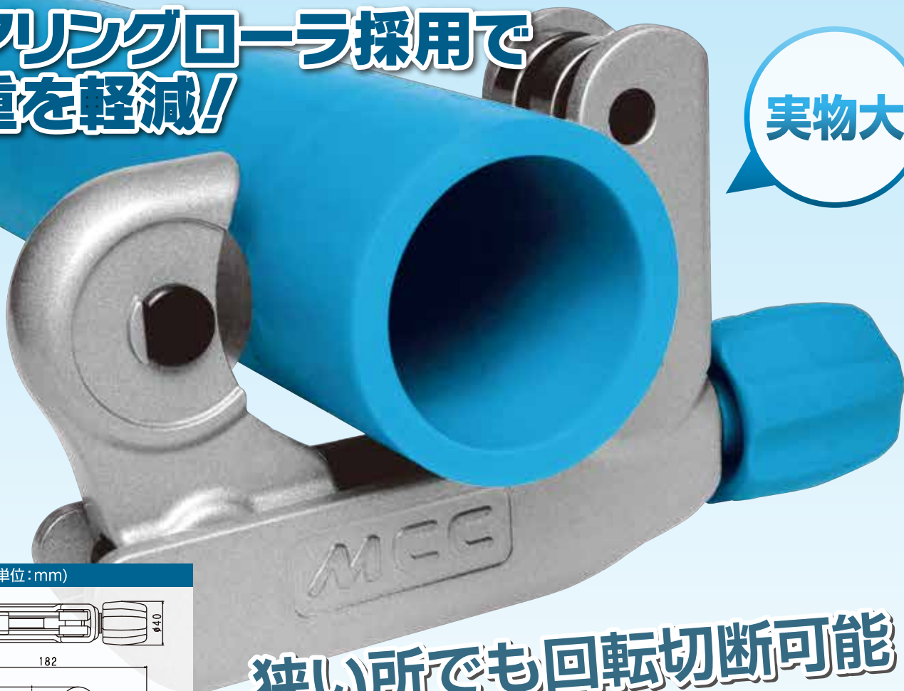
■ 寸法図 (単位:mm)